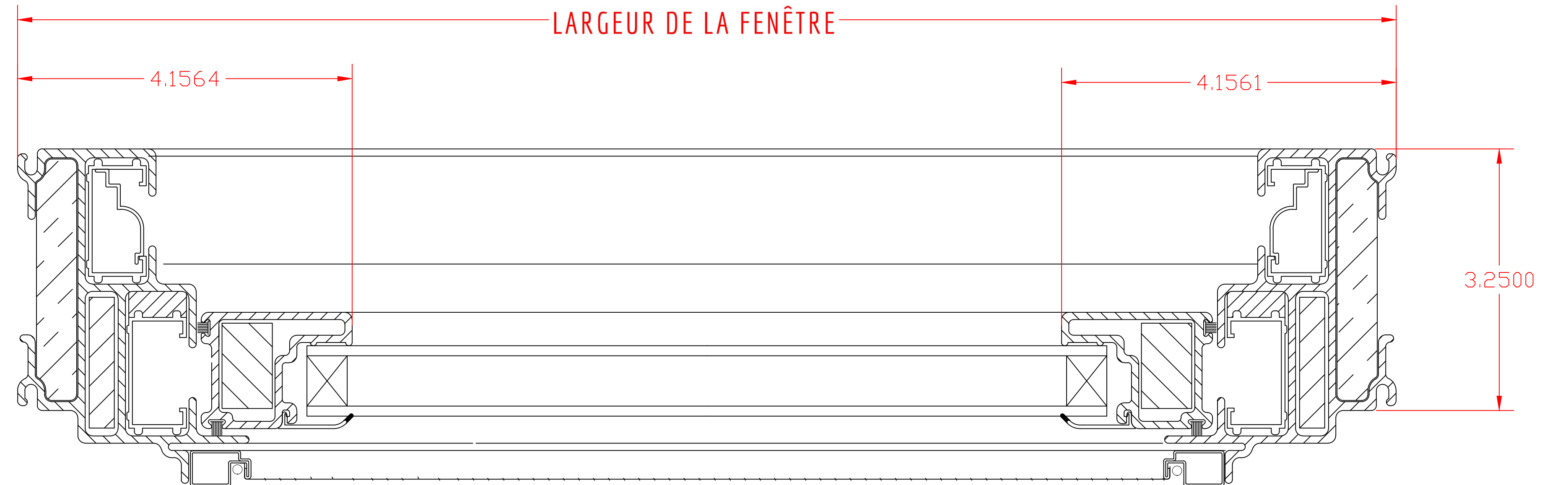
HAUT DE CHÂSSIS À GUILLOTINE